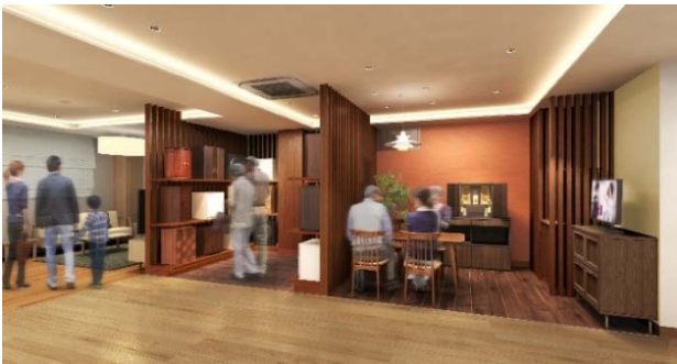
↑仏壇展示コーナー 仏壇コーディネートルーム…③