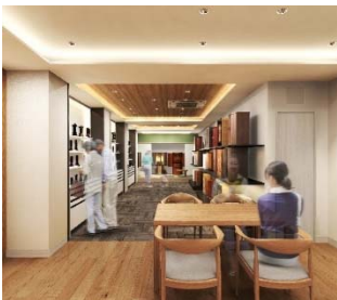
←位牌展示コーナー…④