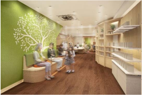
←コミュニティラウンジ …①