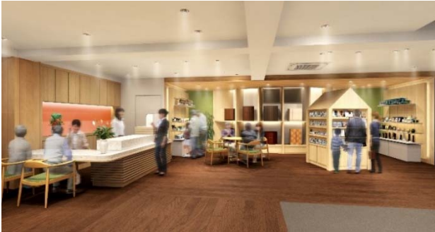
←仏壇展示コーナー…②