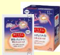
めぐりズム 蒸気でグッドナイト