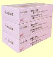
くらしの友オリジナル BOXティッシュ