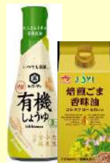
特選有機しょうゆ 焙煎ごま香味油セット