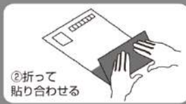
②折って 貼り合わせる