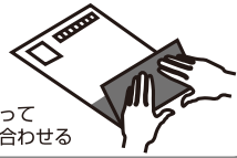
②折って 貼り合わせる