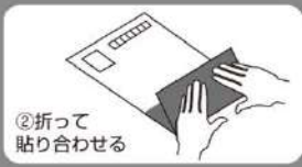
②折って 貼り合わせる