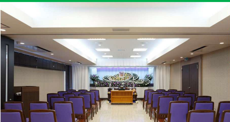
「2F式場」 大規模な社葬・団体葬まで 行える格式に満ちた式場です