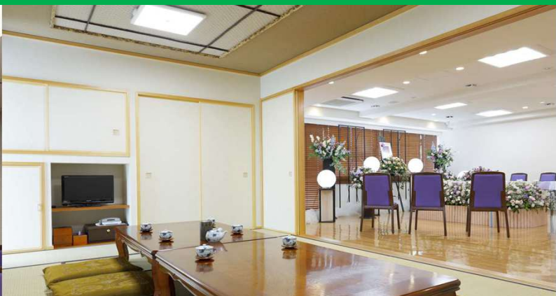
「4F式場」 家族葬や音楽葬などが行える 自由度の高い式場です

普段なかなか見る機会のない設備をご覧ください。ご家族・ご友人お誘いあわせの上、ぜひお越しください。