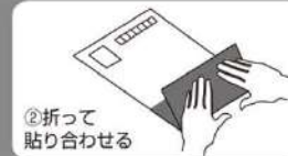
②折って 貼り合わせる