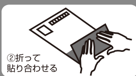
②折って 貼り合わせる