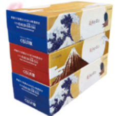
くらしの友 BOXティッシュ