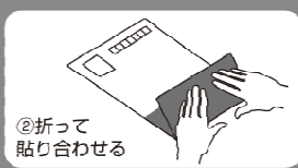
②折って 貼り合わせる