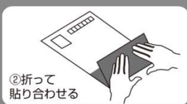
②折って 貼り合わせる