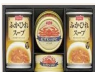
カニ缶ふかひれスープ