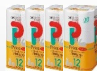
トレット ® -パ ® -1年分