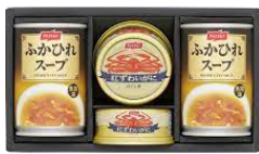
B.ニッスイ カニ缶ふかひれスープ