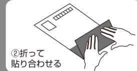
②折って 貼り合わせる