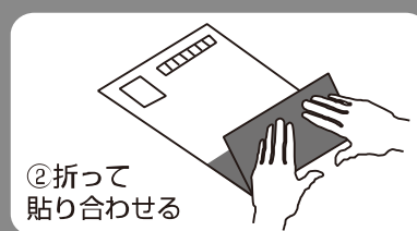
②折って 貼り合わせる