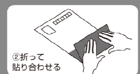
②折って貼り合わせる