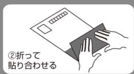
②折って 貼り合わせる