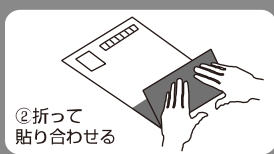
②折って 貼り合わせる