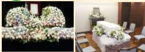
津田山総合斎場 オリジナルシルク祭壇