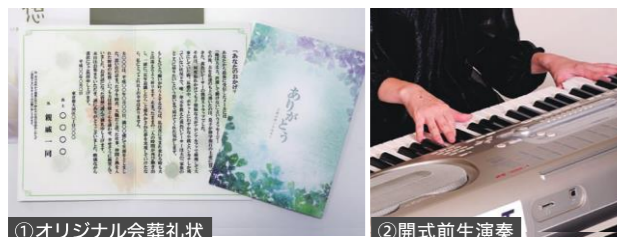
①オリジナル会葬礼状