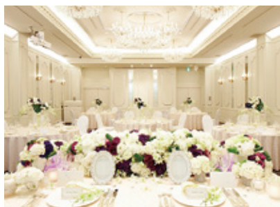
東京・蒲田プラザ・アペア

新横浜駅から徒歩約1分。伝統とモダンを併せ持つヨーロッパスタイルの空間が魅力のウエディングのためのホテルです。ラグジュアリーな雰囲気とホスピタリティあふれるサービスで、大切な一日を最高に輝く時間に演出します。