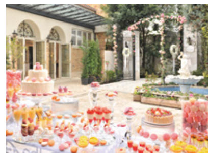
パトリック・キン・ガーデン

最寄り駅から徒歩約2分の好立地にある、「バラ」をコンセプトにした1日2組限定の結婚式場。ワンフロア貸し切り型のプライベート空間と、本物志向のおもてなしで、特別な一日が最高の幸せで包まれる、おふたりらしいウエディングを叶えます。