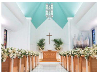
新横浜グレイスホテル〈ロゼアン シャルム〉

新横浜駅から徒歩約1分。伝統とモダンを併せ持つヨーロッパスタイルの空間が魅力のウエディングのためのホテルです。ラグジュアリーな雰囲気とホスピタリティあふれるサービスで、大切な一日を最高に輝く時間に演出します。