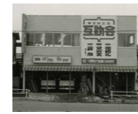
東京新生活互助会本部

「結婚式やお葬式にお金がかかりすぎる」「葬儀は急な話なので葬儀社の言いなりになりがち」。そんな地域の人たちの声に後押しされて、ぐらしの友は昭和42年、東京都大田区蒲田に「東京新生活互助会」として創業。以来、「地域との和合」をモットーに、婦人会や町内会、老人会の皆様にご賛同いただき、皆様からの期待やご支援にお応えしながら半世紀にわたって発展してきました。昭和48年に、互助会の法制化により関東地区「第1号」の通産大臣許可を取得。現在では、約5,000の支援団体に支えられ、地域の互助会として皆様に親しまれています。また、お客様からの信頼にお応えすべく、お預かりする個人情報については厳重に管理。個人情報について適切な保護措置を講ずる体制を整備している事業者などに付与されるプライバシーマークを取得しています。